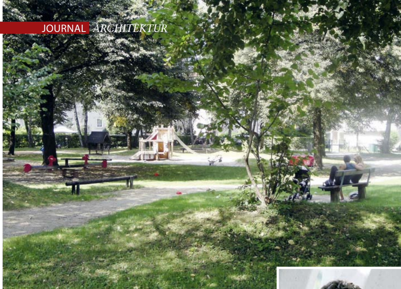
Lehen ist grün: Alle Grünräume von Lehen wurden kartografiert und bewertet, so auch der Spielplatz in der Leonhard-von-Keutschach-Straße, einer von zwölf Parks und Spielplätzen im Stadtteil.